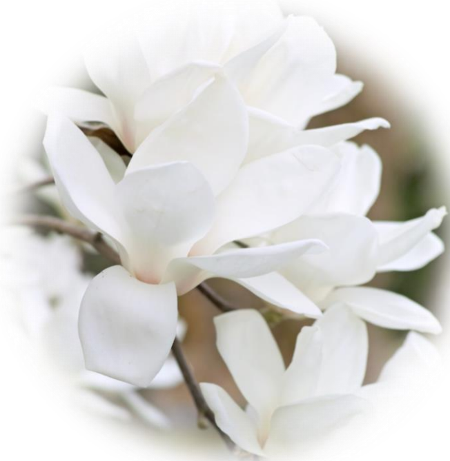
白木蓮（ハクモクレン、White Magnolia） 花言葉：「崇高」「気高さ」「高潔な心」「慈悲」

『グリーフ相談支援ネットワーク』ではあなたにとって無理のないオーダーメイドのサポート方法を一緒に考えます。